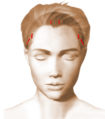
Incisions = cicatrices

Le jour de l'intervention, au moindre doute, un test nicotinique urinaire pourrait vous être demandé et en cas de positivité, l'intervention pourrait être annulée par le chirurgien.